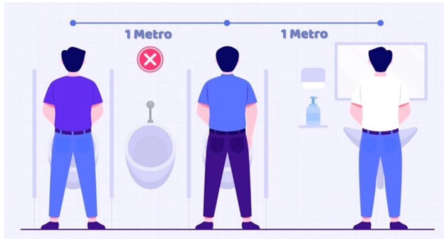
Ejemplo de prácticas para asegurar distanciamiento físico en urinarios