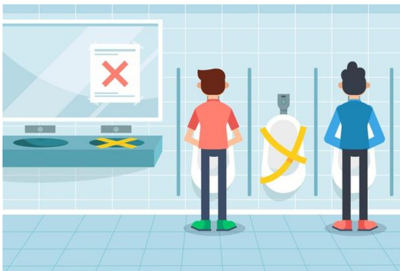
Ejemplo de prácticas para asegurar distanciamiento físico en urinario