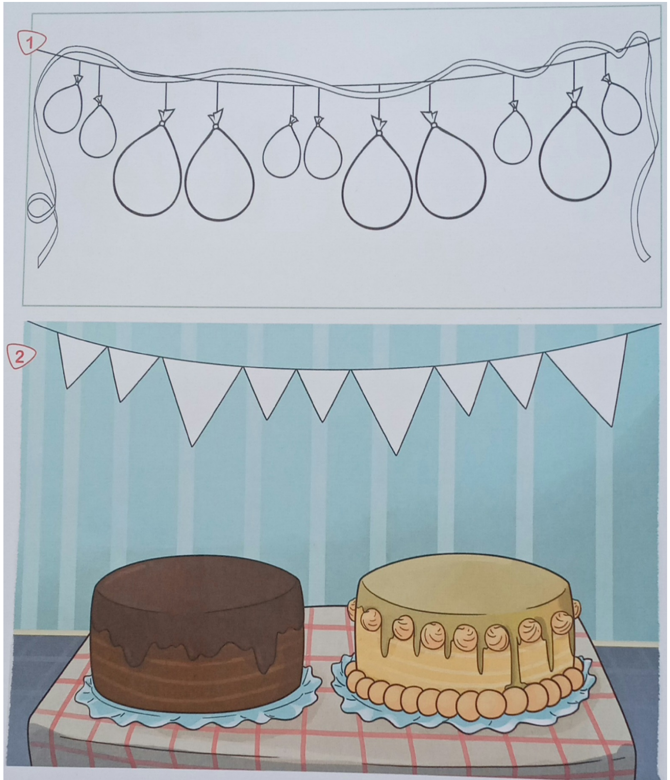
Clasificación por un atributo: tamaño