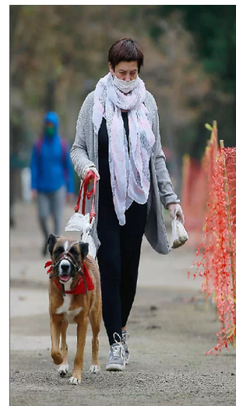
El 9,3% de todos los permisos temporales, a nivel nacional y desde que comenzaron las cuarentenas, corresponde a paseo de mascotas.

Explica Velásquez que el promedio de la población de cada comuna que pide esta clase de permisos diariamente está entre el 10 y el 11 por ciento.