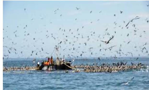
Zona pesquera muy rica

Observa las imágenes y coméntale a un miembro de tu familia a qué fenómeno representan.