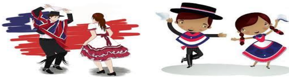
LISTA DE COTEJO

Actividad jueves 24 de septiembre: Bienvenidos a este gran recorrido por Chile, en él, conocerás la historia, costumbres y tradiciones de nuestro país. En esta asignatura aprenderás sobre los bailes y música típica de nuestro país: la cueca. Es un género musical y una danza de parejas sueltas mixtas de finales del siglo XVIII. Los bailarines, quienes llevan un pañuelo en la mano derecha, trazan figuras circulares, con vueltas y medias vueltas, interrumpidas por diversos floreos.