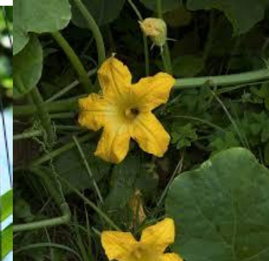
Flor de Zapallo