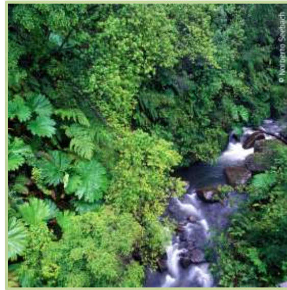
Rupameica Región de Los Ríos