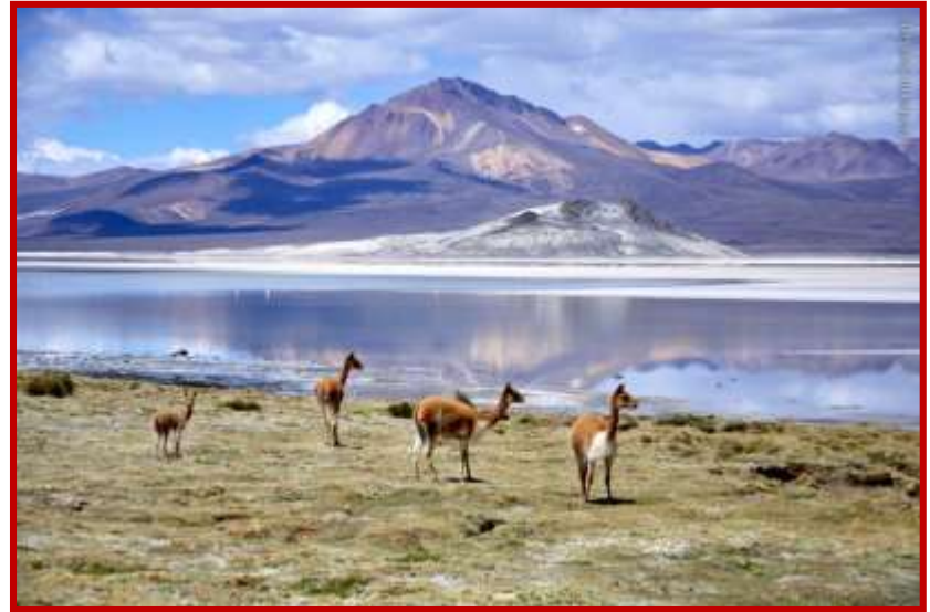
Salar de Surire Región de Arica y Parinacota