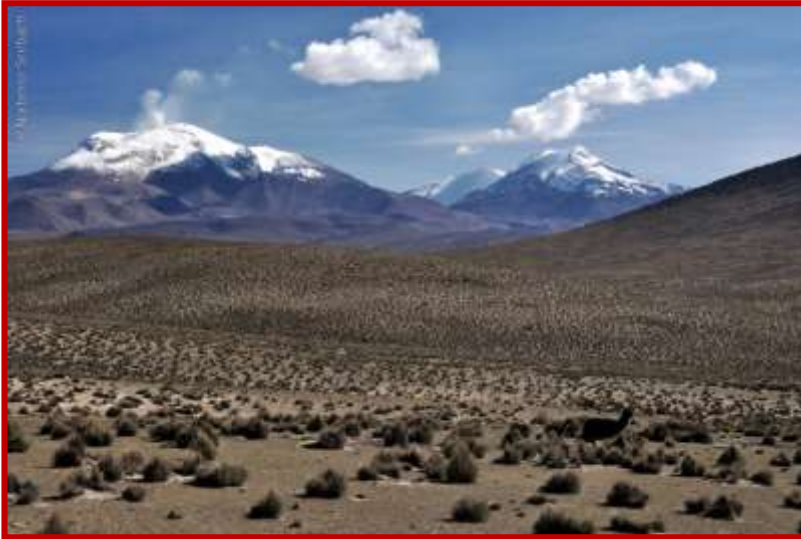
Guallatire Región de Arica y Parinacota