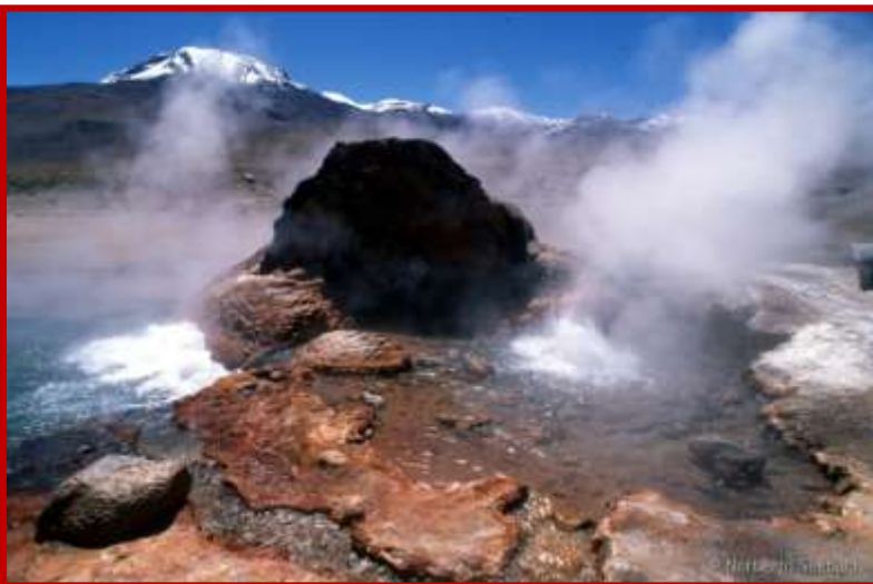
Geysers del Tatio Región de Atacama