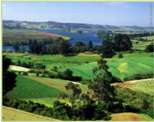
Imperial Región de La Araucanía