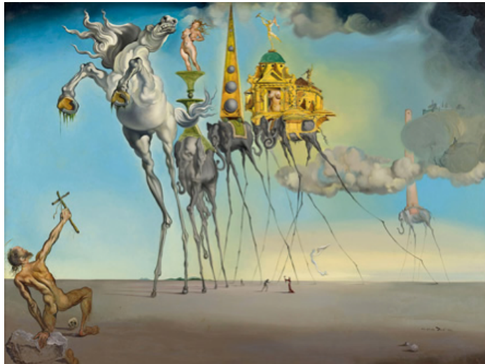
La tentación de San Antonio