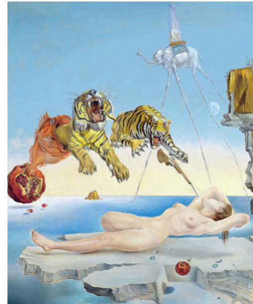
Sueño causado por el vuelo de una abeja alrededor de una granada un segundo antes de despertar.