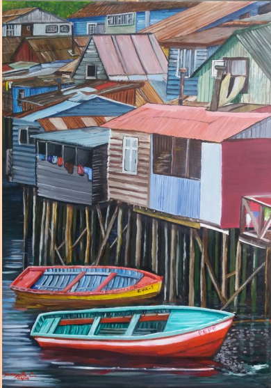
Georgette Castro - Palafitos Chiloé - óleo sobre tela de 50 x 70.