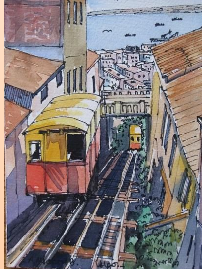
Ascensor de Valparaíso Bretoto Alderete Bernal.