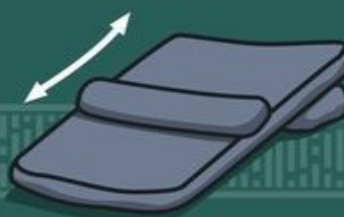
Kuzi Piedra para moler