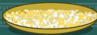
Llepü Balay plano