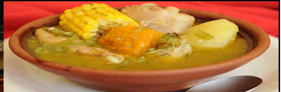
Cazuela de Ave