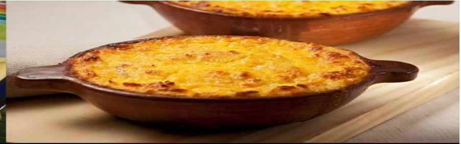
Pastel de Choclos