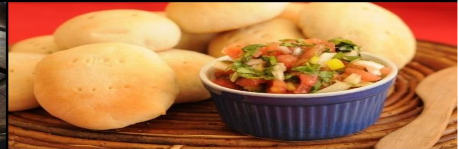
Pan amasado y pebre