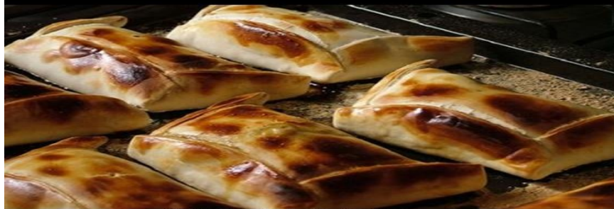
Empanadas de horno