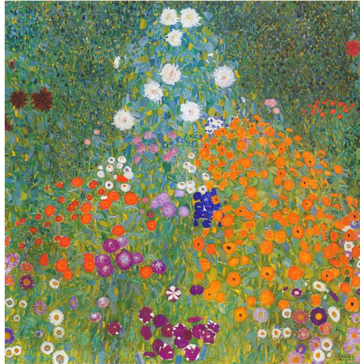
Jardín de la Granja de Gustav Klimt

¿Qué colores observan en esta pintura? ¿cómo se llaman? ¿Hay colores primarios? ¿Cuáles?